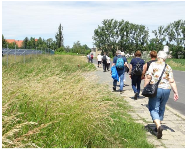
Pilgergruppe der Pfarrei Altenburg 2018