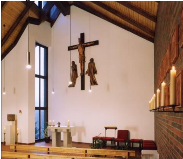
Kirche Christus König Bad Lobenstein

Gemeinsam unterwegs lernen wir am Wegrand interessante Denkmale aus der Geschichte der Region kennen, sehen die Veränderung der Landschaft durch den Uranbergbau und Klimawandel und beten in persönlichen und gemeindlichen Anliegen.